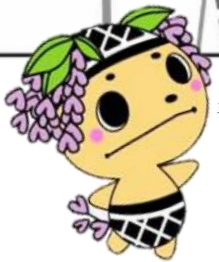
三斎市の マスコット キャラクター くらモニ