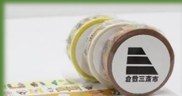
マスキングテープ発祥の地倉敷

ご来場アンケートにお答えいただいた 先着 100 名様 朝市当日 8:00~10:30 に BIOS 憩いの広場 朝市本部の 受付スタッフへ アンケート回答画面をご提示ください