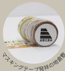
マスキングテープ発祥の地倉敷

朝市当日8:00～10:30 朝市本部の受付スタッフに フォロー画面をご提示ください