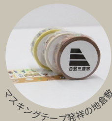
マスキングテープ発祥の地倉敷

朝市当日8:00～10:30 朝市本部の受付スタッフに フォロー画面をご提示ください